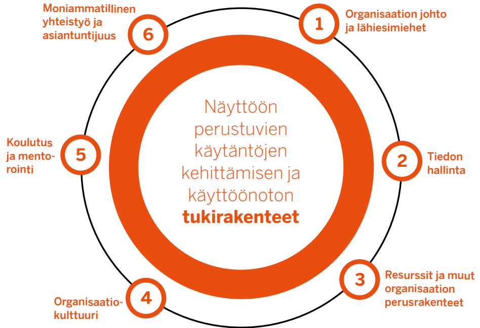
Kuvio 2. Näyttöön perustuvien käytäntöjen kehittämistä ja käyttöönottoa tukevat rakenteet (mukaellen Korhonen ym. 2018)

Yhtenäisten käytäntöjen kehittämisen eri vaiheissa tulee kiinnittää huomiota organisaation tukirakenteisiin (Kuvio 2) ja niiden kehittämiseen. Tukirakenteet ovat keskeisiä organisaatioon liittyviä tekijöitä, jotka voivat joko edistää tai puutteellisesti toteutuessaan estää näytön käyttöönottoa ja vakiintumista. Siten tukirakenteiden vahvuudet ja mahdolliset puutteet on hyvä tunnistaa jo varhaisessa vaiheessa ja vahvistaa niitä mahdollisuuksien mukaan. Näyttöön perustuvan kättilö- ja terveydenhoitajatyön kehittämisen ja käyttöönoton mahdollistajana organisaation johto ja lähiesimiehet ovat keskeisessä roolissa. Muita keskeisiä tukirakenteita ovat esimerkiksi seuranta- ja arviointitiedon hallintaan käytettävät menetelmät, organisaation perusrakenteet, kuten käytössä olevat resurssit, muutosmyönteinen organisaatiokulttuuri, henkilökunnan koulutus ja mentorointi sekä moniammatillinen yhteistyö ja monialainen asiantuntijuuden hyödyntäminen (5) .