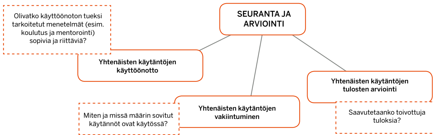
Kuvio 5. Yhtenäisten käytäntöjen seuranta ja arviointi (pohjautuen Korhonen ym. 2018)

ja saavutettuja tuloksia verrataan suhteessa suunnitelmaan ja siihen kirjattuihin tavoitteisiin. Siten toiminnassa voidaan tunnistaa jatkokehittämistarpeita. (5)