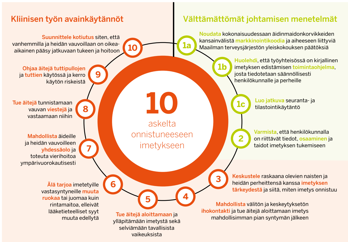
Taulukko 1. Kymmenen askelta onnistuneeseen imetykseen WHO 2018 (40) mukaisesti suomennettuna (käännösluonnos)